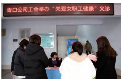
青口公司“关爱女职工健康”义诊