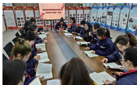
氨纶公司“润泽书香,沐浴幸福”读书活动