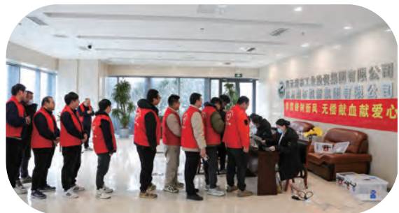
供电、供销、房地产公司无偿献血活动