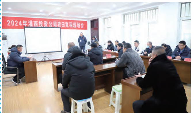
近日，灌西投资公司举办2024年农田发包竞租现场会，对4个标段近2000亩到期农田进行公开租赁，参与竞租的种植户达30余人。据了解，此次农田竞租，亩均价格比底价提高了100余元。（季兴胜）

聚焦安全生产，管理能力取得新提升。推进安全文化建设，发挥安全文化长廊宣传引导作用。制定年度安全生产培训计划，开展安全管理制度、安全操作规程、职业健康养成等培训，提高职工的安全意识、安全能力。开展安全生产隐患排查整治活动，强化事前防范和事中监管，确保安全风险点可控受控。完善《公司安全事故应急预案》，组织应急救援演练，强化应急救援队伍建设，健全应急物资储备体系，增强应对安全事故的处置能力和应急物资保障水平。（金宣）