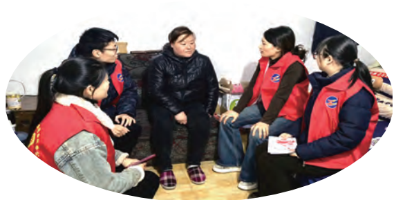
灌西公司志愿者入户征集困难群众“微心愿”