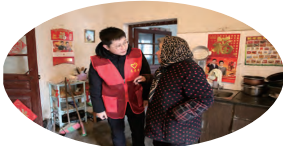
青口投资公司“情暖空巢老人 彰显社会担当”暖春关爱活动