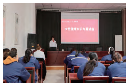
神特公司女性健康知识专题讲座