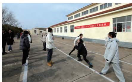
徐圩公司迎“三八”女职工文体活动