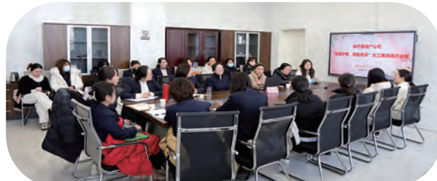
房地产公司“追逐梦想、绽放风采”女工素质提升讲座