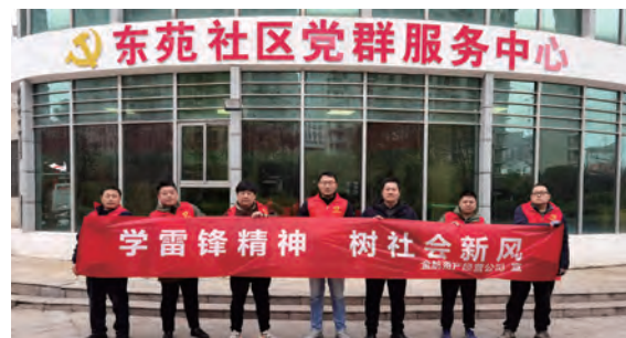
金航公司“学雷锋精神，树社会新风”主题活动