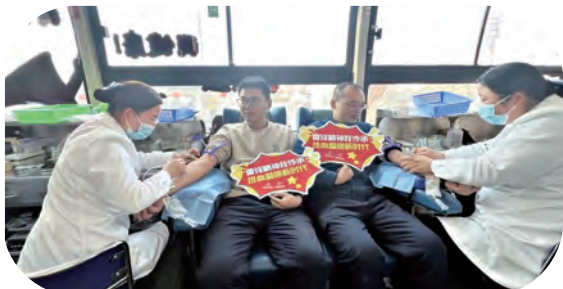
板桥片区共建单位义务献血活动