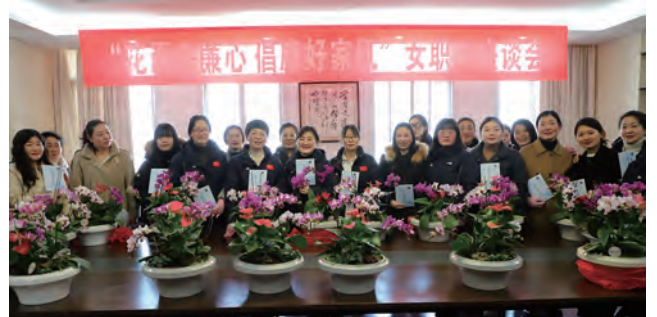
灌西公司“花语寄廉心 倡廉好家风”女职工座谈会