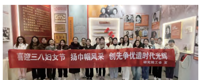
研究院女职工参观“雷锋车”事迹陈列馆