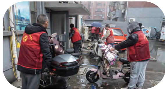
台北公司志愿服务队走进东园社区学雷锋志愿服务