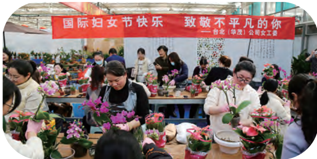
台北华茂公司女职工插花活动