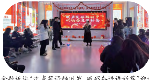
金融板块“欢声笑语辞旧岁,砥砺前行谱新篇”迎新年联欢会