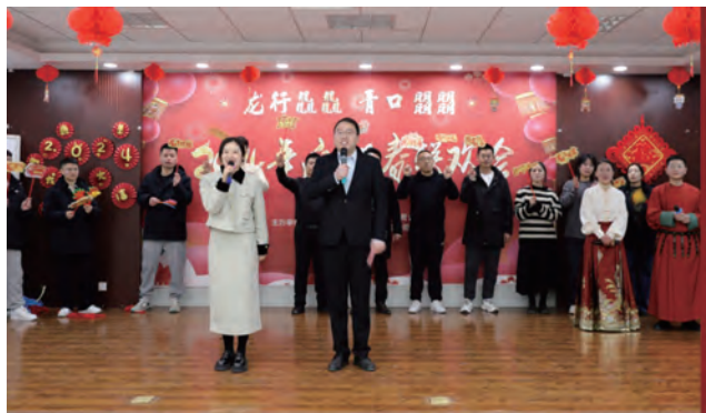
青口投资公司迎新春联欢会