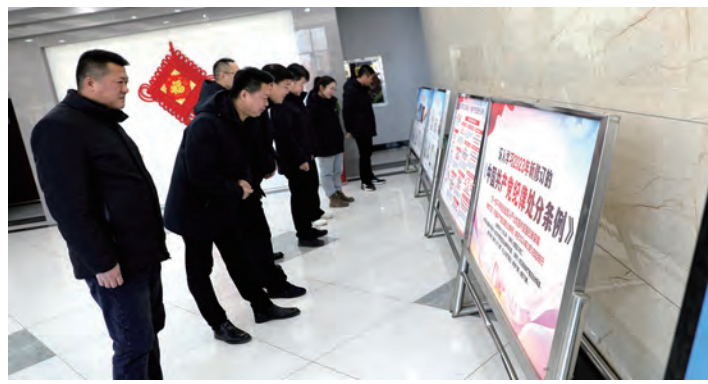
春节将至，为持之以恒推进正风肃纪，青口投资公司纪委组织干部职工集中观看反腐电视专题片和警示教育展板，开展形式多样的节前廉洁提醒工作，为党员干部敲响警钟，确保节日期间风清气正。（瞿方）

举措实，长鸣廉洁冲锋号。紧紧围绕“收心归位”的思路，节后将通过现场检查、电话抽查等方式，对职工纪律作风、工作状态等进行监督检查，对纪律松散、岗位缺位、作风拖沓等及时提醒。引导全体职工增强纪律规矩意识，守住纪律红线，不断强化廉洁自律意识。（郭坤）