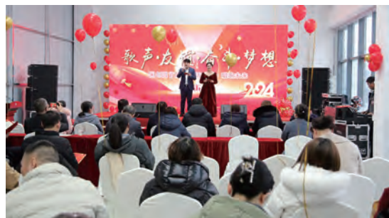
国际医药创新产业园首届文体活动周