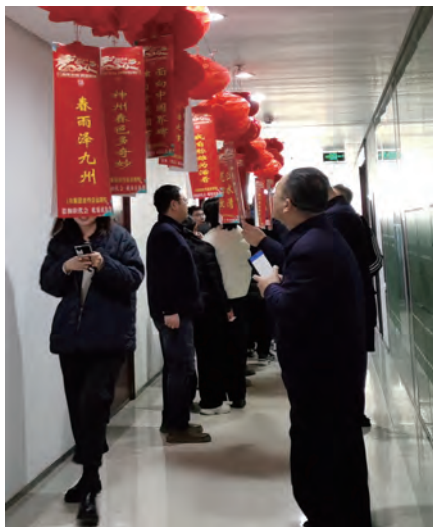
集团总部“贯彻职代会 欢乐庆佳节”猜谜