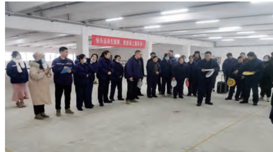
神特新材料公司趣味运动会