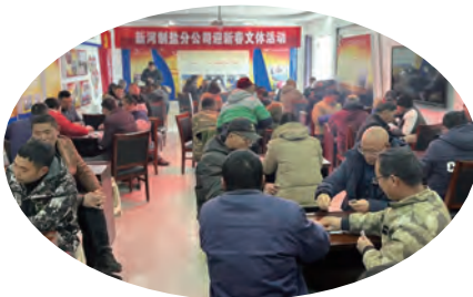
日晒制盐新河分公司职工文体活动