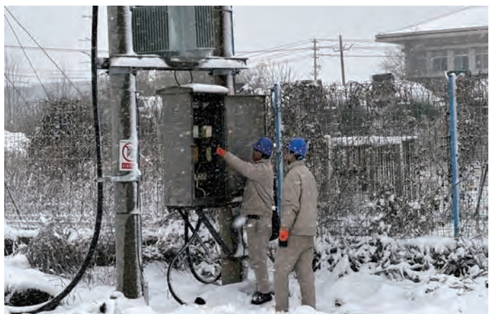
2月4日至5日，供电工程分公司徐南供电所组织职工对辖区内10千伏线路及电力设备开展专项检查，这是雨雪凝冻后该所对供电线路设备进行的新一轮特巡工作。（周国成）

是动力。在新的一年里，集团女工委将团结带领广大女职工发奋图强、勤于工作、勇于创新、乐于奉献，为集团提质增效、强链扩规凝聚女职工力量。（工宣 工会）