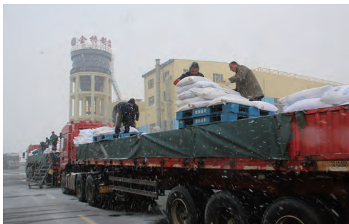
1月31日以来，受极端天气影响，江苏、山东、安徽、河南等地区融雪盐订单激增。金桥制盐公司迅速应对，合理调配人员，科学组织生产，有效保证市场供应。截至2月6日，生产、销售3690余吨融雪盐。（胡刚 伏胜杰）