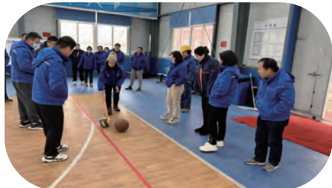
利海公司“迎新年、聚合力、展作为”职工趣味运动会