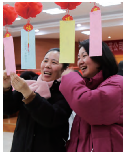
台北、华茂公司“迎新春 送清风”廉政主题猜谜