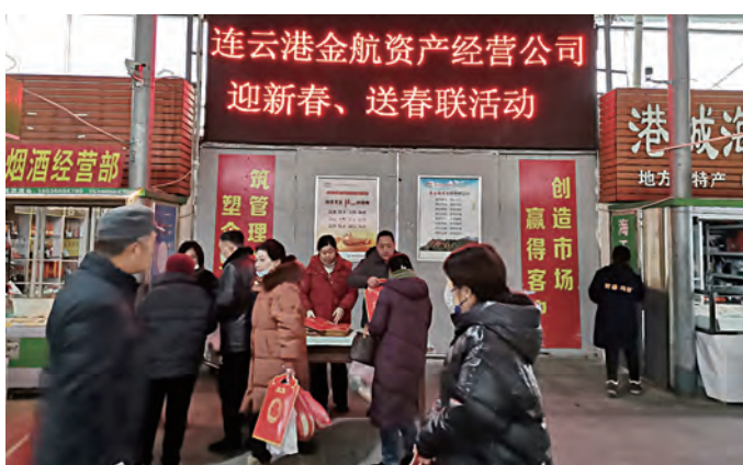
春节将至，年味渐浓。近日，金航资产公司巨龙路农贸市场和万家欣装饰市场联合举办了一场别开生面的活动——为商户和顾客送上精心准备的对联，为大家送上新春最美好的祝福。（卢新全）

构建“一二三”机制，使流动党员“提升提高”，让培养全维度。围绕“劳模开讲啦”、技能实训基地、三个职业发展通道，鼓励流动党员加强学习、勇挑重担，哪里有困难就到哪里去，在实践中不断提升自己的业务技能和专业知识，让每一名党员就是一面鲜红的旗帜，使党建工作能够全覆盖无死角。（电宣）