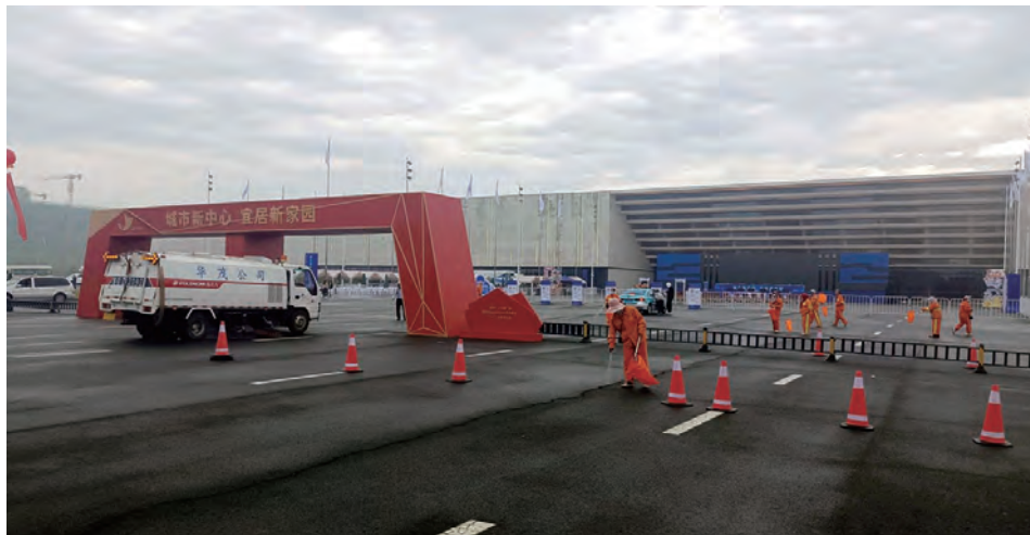
从环卫保洁到绿化养护，从垃圾清运到花卉租摆，从市政维修到路灯维保……国庆假期，华茂绿化工程公司广大职工奋战在各自岗位，在辛勤工作中度过假期，以坚守诠释担当，用奉献精神书写责任，以实际行动迎接党的二十大胜利召开。（徐明磊 张义荣）

严意识形态，固思想阵地。该公司党委就进一步加强意识形态管理工作进行专题研究部署，制定工作责任清单，全力以赴抓好意识形态管控。组织学习《习近平谈治国理政》第四卷，加快提升意识形态工作管控能力及党员干部的知识储备和工作能力。启动意识形态风险点自查行动，做好网络意识形态风险防范工作，进一步加强对微信群、QQ 群等工作交流群以及抖音等自媒体账号专项检查和管控，营造文明网络环境。（仲伟彬）