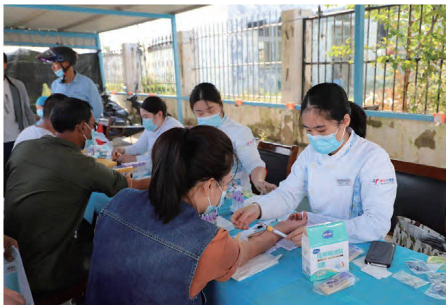
为切实保障职工的身心健康,国庆节前夕,灌西投资公司工会组织灌西投资公司、日晒制盐公司718名职工进行健康体检。(杨婕)