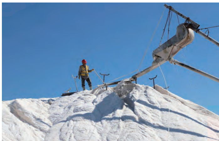
国庆长假，日晒制盐公司广大员工放弃休息，应对不利天时，加强值班，及时做好塑料布收放等工作，强化“三雨操作”，快速恢复生产，10月7日，10台扒盐机组全部恢复开机扒盐，入秋以来，已扒盐11600余吨。（季兴胜）

筑牢安全生产生命线。严格执行安全生产法律法规，突出抓好安全责任落实；立足超前防范，抓好隐患排查治理，从工艺设备、作业环境、人为因素等方面，拉网式、全方位开展大排查；加大监督检查力度，严格查处各类隐患和“三违”现象，确保安全生产；重点抓好现场管理，尤其是加大对装货车辆、叉车、行车的现场管理力度；常态化做好疫情防控工作，严格落实疫情防控各项措施，坚决克服侥幸心理和麻痹思想。（龚成文）