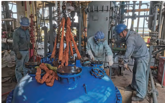
9月25日,利海化工公司苯甲醛装置水解釜完成安装工作,为装置满负荷生产、释放产能奠定了坚实基础。图为安装工人进行作业。

融担再担共联提升发展活力。以“联同业,促发展”为着力点,依托与省再担保公司多年建立的业务纽带,以党建共建为载体搭建双方新的合作桥梁,实现资源共享,增进员工间友谊。通过组织徐圩新区团建拓展活动,进一步促进双方合作水平,互相促进内部提升;组织员工,参加由省再担保公司组织的中国长三角融资担保行业技能大赛,以赛促学,不仅取得了良好的成绩,在员工技能提升,打造学习型、专业化的员工队伍方面也取得了明显的实效。(金作鹏)