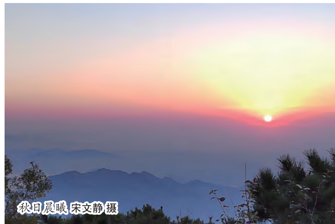
秋日晨曦