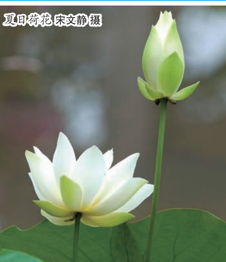
夏日荷花

军民伤亡,这些鲜活生命依然历历在目。因此,更要珍惜来之不易的和平,在发展同时,时刻不忘这是先辈们用生命换来的。我们期待和平、珍惜和平,但要时刻保持清醒,时刻警惕“忘战必危”。