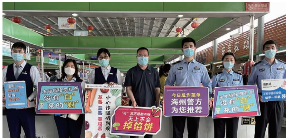
近期,金航巨龙农贸市场配合海州区反诈中心民警及银行工作人员以“严厉打击电信网络诈骗犯罪,构建平安和谐社会”为主题,多措并举、创新形式、突出重点,在市场对商户和消费者进行电信网络诈骗宣传活动,收到良好效果。(金航宣)

唱响优质服务“新和声”。开展分管负责人年初述职评实招、年中述职评实干、年底述职评实绩“三述三评”工作,举行现场述职评会10场次。开展青年管理人员“上挂提站位、平挂强业务、下挂走基层”多轮岗实践活动,20名青年管理人员跨单位、跨部门、跨领域挂职锻炼。首批开展8个基层班组“双向双促”主题实践活动,签订10份“优带优”协议书。(陈健)