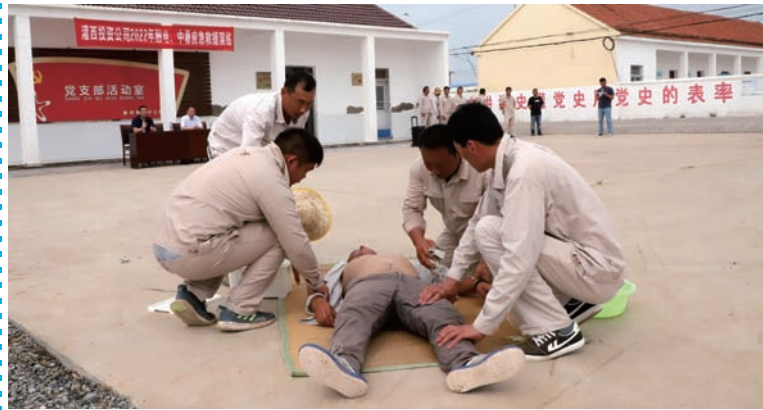
近期,由于天气持续高温,为防止职工在作业中出现中暑问题,保障作业人员身体健康,灌西投资公司在分河制盐分公司开展中暑、触电应急救援演练,来自各单位党政负责人、分管安全领导、班组长参加观摩。(杨美娟)

运营管理质量提高。规范加强项目建设,完成高标准生态化池塘建设项目地形图、规划设计工作,地形图测绘已完成并通过验收,高标准生态化池塘建设项目规划初稿已编制完成,进入区、市局评审阶段。完成23项场内维修工程方案,保障生产平稳运行。从“严”做实安全管理,组织开展“安全三年专项整治行动”“隐患排查月系列活动”“安全生产月”等安全专题活动7次。开展办公场所紧急疏散演练,有效增强员工的防灾减灾意识,切实提高全体员工安全生产意识和基本操作技能。(顾益)