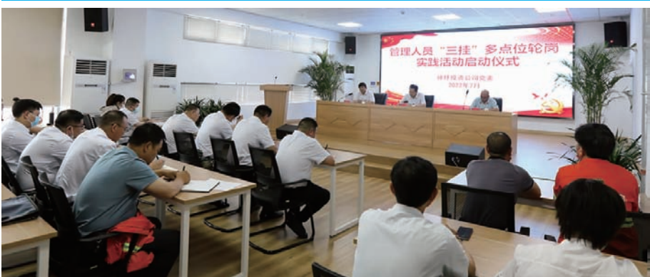
7月8日,徐圩投资公司召开“三挂”多点位轮岗实践活动启动仪式。20名青年人员按照“上挂提站位·平挂强业务·下挂走基层”要求,跨单位、跨部门、跨领域轮岗挂职锻炼,提高抓改革、促发展、保稳定的实践能力,培养造就一支“高素质、强本领、敢担当、善作为”复合型人才队伍,助力企业全面高质量发展。