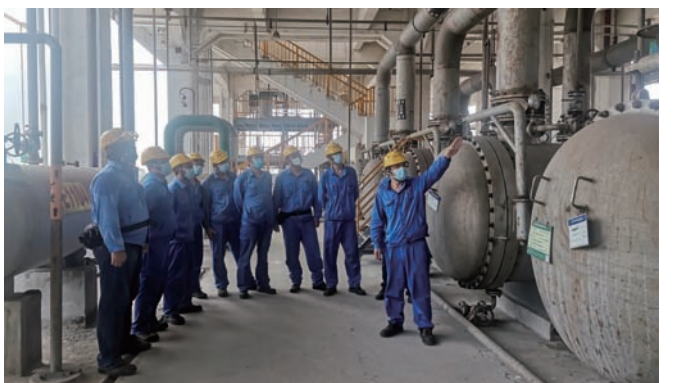
今年,利海化工公司建立“点面结合、量体裁衣”培训长效机制,科学制订年度培训200余项,截止目前完成内培外训126项,员工参训达2400余人次。图为双氧水装置组织开车前人员培训。

全力抓好内控管理工作。一是进一步提高政治站位,扛起巡察整改政治责任,认真贯彻市委巡察整改工作的各项要求,深化思想认识,立行立改。二是落实“党政同责”“一岗双责”,继续保持“开小灶”劲头,坚决完成“三年大灶”目标任务。以《新安全生产法》宣传贯彻为重点,印发“第一责任人安全倡议书”,督促企业主要负责人严格履行安全生产法规定的7项职责。结合公司实际,狠抓工作落实,做到防汛有预案、有对策,确保企业平安度汛。三是加快推进产业工人队伍建设,以“三岗”为根本,分类分级建设(领军型干部、创新型技术、工匠型员工)三支队伍,加快形成适应高质量发展要求的队伍体系。(房宣)