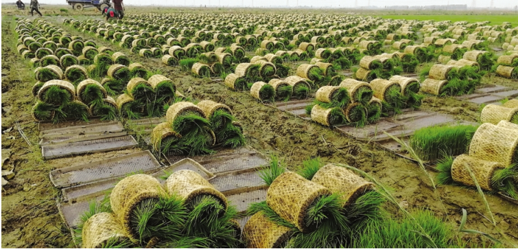
近日,青口投资公司万亩水稻插秧全面铺开。自6月3日起,自营水稻插秧率先开展。各条田组全力以赴投入插秧工作中,抢农时、机械化作业,为插秧赢得主动。近年来,该公司农业机械化程度大幅提升,机插秧面积由去年的5000亩增加到7000亩,机插秧面积达到70%。图为:机插秧苗等待转运。(尤冬冬)

坚守岗位奋战高温。为了抢时间、赶进度、保工期,在于广兵、孙正宏、李恒柱等党员骨干的带动下,他们从未喊苦叫累,停下歇息,直至完成分配的任务。(陈明华)