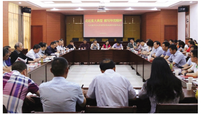
为大力弘扬工匠精神、劳模精神。6月2日,连云港市杂文学会作家一行三十余人走进市级重大典型——华茂公司,开展为期一天的实地采风采访创作活动,以华茂故事传承发扬华茂精神。(王芬)