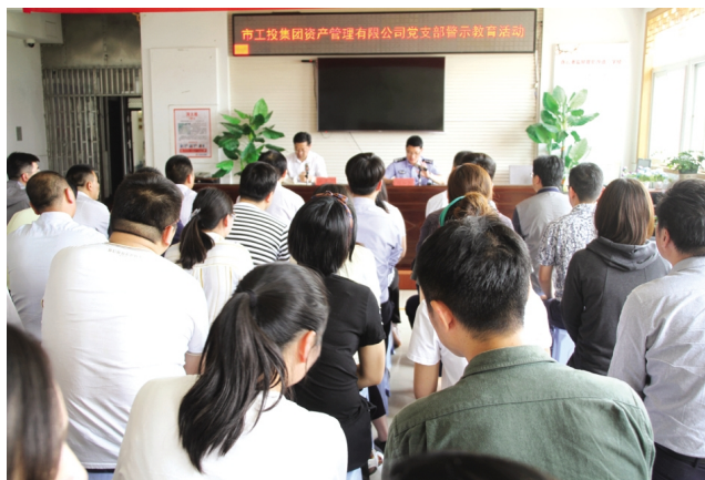
连日来，集团公司金融板块、台北、徐圩投资公司等单位纷纷组织人员赴连云港监狱开展警示教育活动。提高拒腐防变能力，正确把握人生航程。