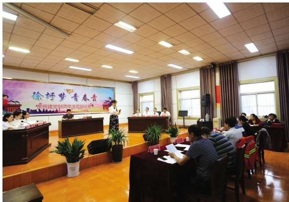
为6月10日下午,徐圩投资公司举办迎“七一”徐圩梦、青春聚一堂主题辩论赛。支辩论队以名辩手汇聚一堂,围绕“青年员工在工作中能力更重要,还是热情更重要”企业管理重在激励,还是在考核”等主题辩题正反展开辩论。(徐宣)

开展廉政专题党课。公司党委书记为党员干部上一堂廉政专题党课,同时表彰2018-2019年度先进党组织、优秀共产党员和优秀党务工作者,并组织新党员宣誓。