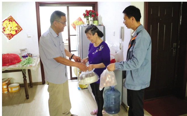
端午佳节前夕，6月5日上午，房地产裕禾物业公司走访看望新城花园小区困难业主，并送去节日的祝福和慰问品，表示将尽最大可能的向他们提供工作及生活中的帮助，让每一位困难业主切实感受到了裕禾物业公司的关怀和温暖。