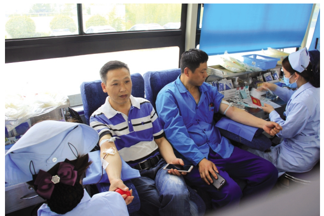
为弘扬无私奉献、乐于助人的精神，助力港城创建全国文明城市，6月5日，金桥制盐公司与板桥片区联动共建单位利海化工公司共同开展无偿献血活动，共计成功献血7500毫升。