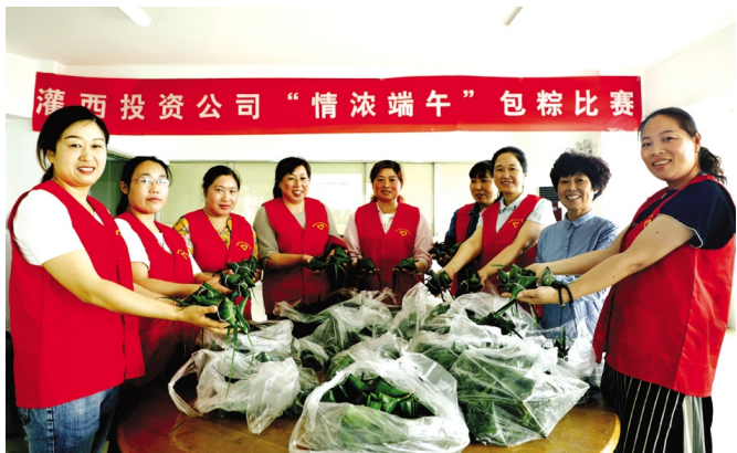
为了传承和弘扬中华优秀传统文化，在端午节来临之际，6月5日下午，灌西投资公司举办“情浓端午”职工包粽子比赛活动。干部职工一起体验端午习俗，并把包好的粽子送给中二圩社区孤寡老人、困难居民，让他们过个祥和、开心的端午节。