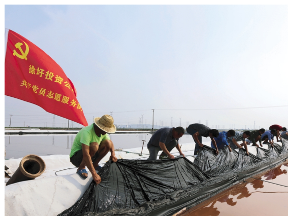
日前，徐圩投资公司新滩服务区党支部坚持以深入推进党员“两学一做”学习教育常态化制度化开展为抓手，积极开展党员志愿者“主动、联动、互动”志愿服务行动，集中深入滩头协助单元完成一些急难性生产任务，提高党员志愿服务实效，促进原盐生产均衡发展。（范永成）