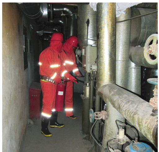
日前，氨纶公司安全部组织甬道间导热油泄漏起火应急演练，50余名员工参与演练。通过应急演练达到了锻炼队伍，检验应急预案的目的。(氨纶宣)

项目转型求稳求实。重点打造中小企业园，按照国家级科技孵化器的标准，积极完善多利科技产业园软硬件条件，着力推进中小企业园二期2栋标准厂房建设。根据集团公司要求，按照新型先进机械厂房的标准，结合新材料、新能源的发展，对厂房进行重新设计，为重点发展中小企业园打好基础并积极探索工业地产开发；选择好调研项目，根据集团公司产业导向，利用现有的厂房和土地资源，重点开发新材料、新能源产业，着重调研新材料UD布以及新能源光伏发电项目。成立重点项目调研组，对省内外城市的相关企业进行考察，在调研了解UD布项目市场潜力的基础上，利用自身的条件与神特新材料开展合作。同时，将美多利中小企业园二期2栋标准厂房作为光伏发电项目试点，充分利用现有的条件，开发光伏发电项目。(韩挺)