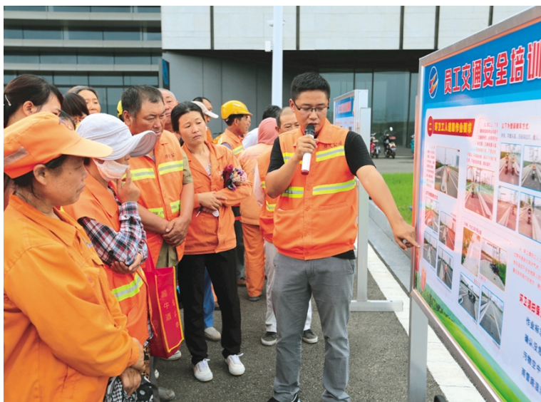
为进一步提高环卫绿化工人的交通安全意识，华茂公司安全管理部门以一些交通事故图片和安全知识为主要内容制作展板到基层单位巡回展示、宣传讲解，通过震撼的事故案例、惨痛的教训警示教育员工，不断增强员工安全意识和自我保护能力，预防交通事故发生。(陈炳辰 王曜)