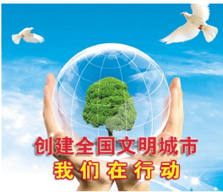
创建全国文明城市 我们在行动

合，改进管理机制，从以往“被动考核整改”向“常态有效管理”转变，采取重点突击和日常管理相结合的办法，完成一项整治任务，巩固一片区域，整治成果由公司分别组织绿化、环卫、市政专业人员负责日常监督及考评，按照“问题出在哪里，责任追到哪里”的原则，做到各负其责，“思想、行动、责任、服务、效果”五到位，对整治成果进行奖惩考核，将承担任务完成“销号”，不留尾巴。